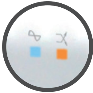
Pantalla LED oculta.

El nuevo y avanzado Regulador de Voltaje Automático R2C, el más completo y de mejor calidad. Este nuevo producto ofrece 8 tomas de salidas, corrige bajas y altas tensiones y proporciona un regulado de 220 VCA.